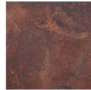
COMPACT CÉRAMIQUE ROUILLE

ilicuit propose à présent des panneaux dérivés du bois : MDF, Valchromat, OSB, ou stratifié compact, afin de multiplier les possibilités d'aménagements avec des produits plus économiques.