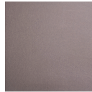
VALCHROMAT GRIS CLAIR